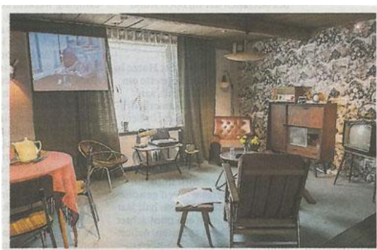
Huiskamer van vijftig jaar geleden.

Om de herkenbaarheid van het museum te vergroten is er een nieuwe vlag gemaakt. Het uithangbord, dat door een vrachtauto kapot was gereden, is gerepareerd en weer opgehangen.