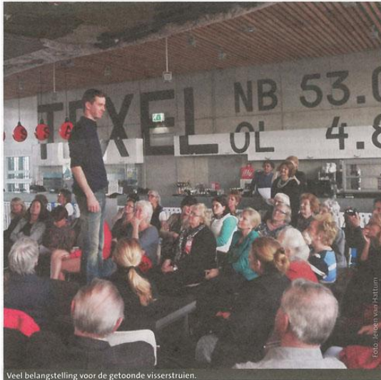
Veel belangstelling voor de getoonde visserstruien.

Modeshow sluit expositie Visserstruien Kaap Skil